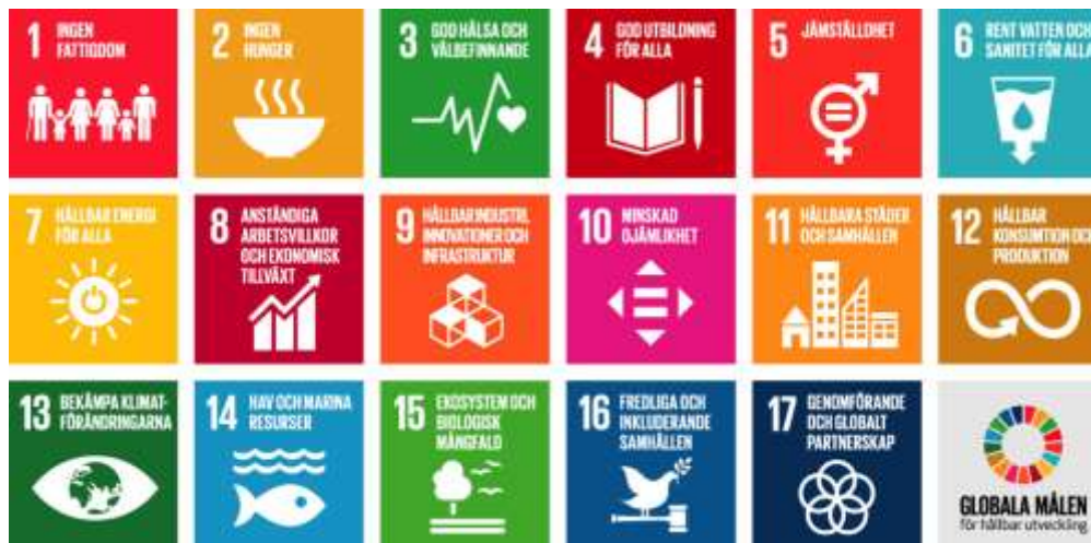
Bild: De globala målen AGENDA 2030.

Genom att utgå från AGENDA 2030 och hållbarhetsmålen för våra mål och insatsområden säkras vi att projekt och verksamhet bidrar till en hållbar omställning och värnar kommande generationer.